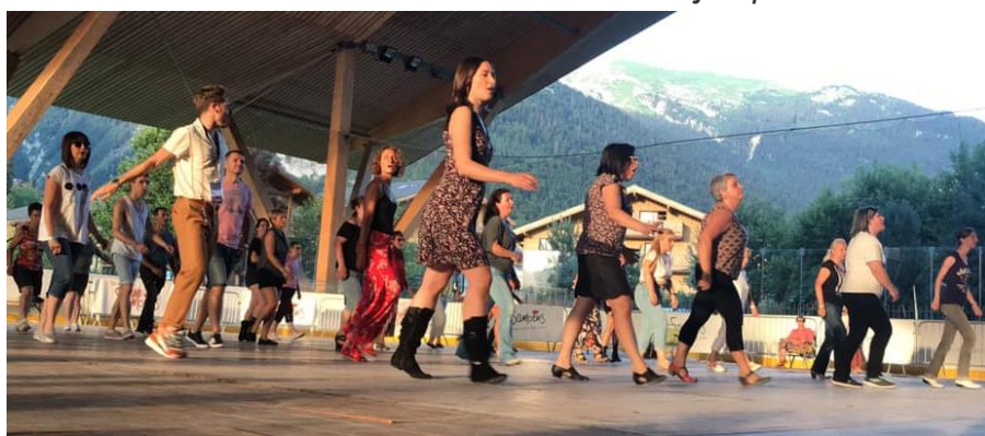
Bal New Line

Les deux lieux connaissent un franc succès jusqu'à 1 heure du matin.