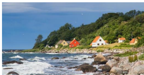
Bornholm est une île du Danemark