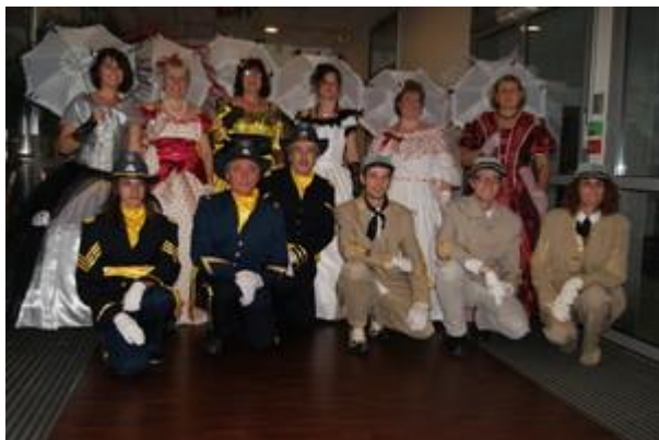
Rebel's Country Dancers 64

Une partie de l'après-midi est consacré à des démonstrations de danses par les clubs présents. Les clubs locaux, Loz' Country Mende et Country Passion 48 présentent leurs danses, suivis par les Rebel's Country Dancers 64 , Black Angels Country et Courpière Country 63 . D'autres animations feront la joie des spectateurs : Zorro et les brigands , maniement du fouet, spectacle amérindien, baptême en Harley Davidson; toutes ces activités sont situées sur la place du Foirail occupée par des stands et village indien, etc. Coté restauration, une très bonne adresse : la brasserie "Le Provençal", propose une carte élargie avec de nombreuses spécialités du terroir.