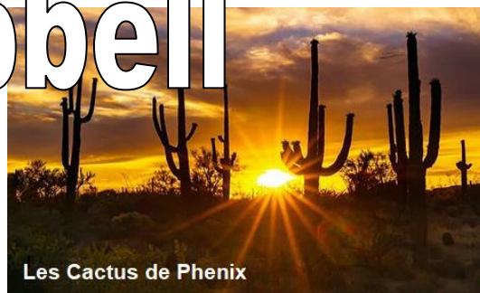
Les Cactus de Phenix